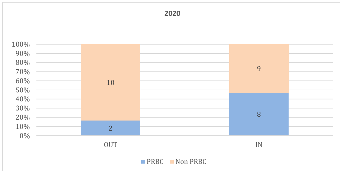
Tableau 4 : Répartition des membres du personnel des SCR entrant et sortant depuis 2020 Tabel 4: De uitsplitsing van de personeelsleden van de DVC die sinds 2020 in dienst traden en vertrokken