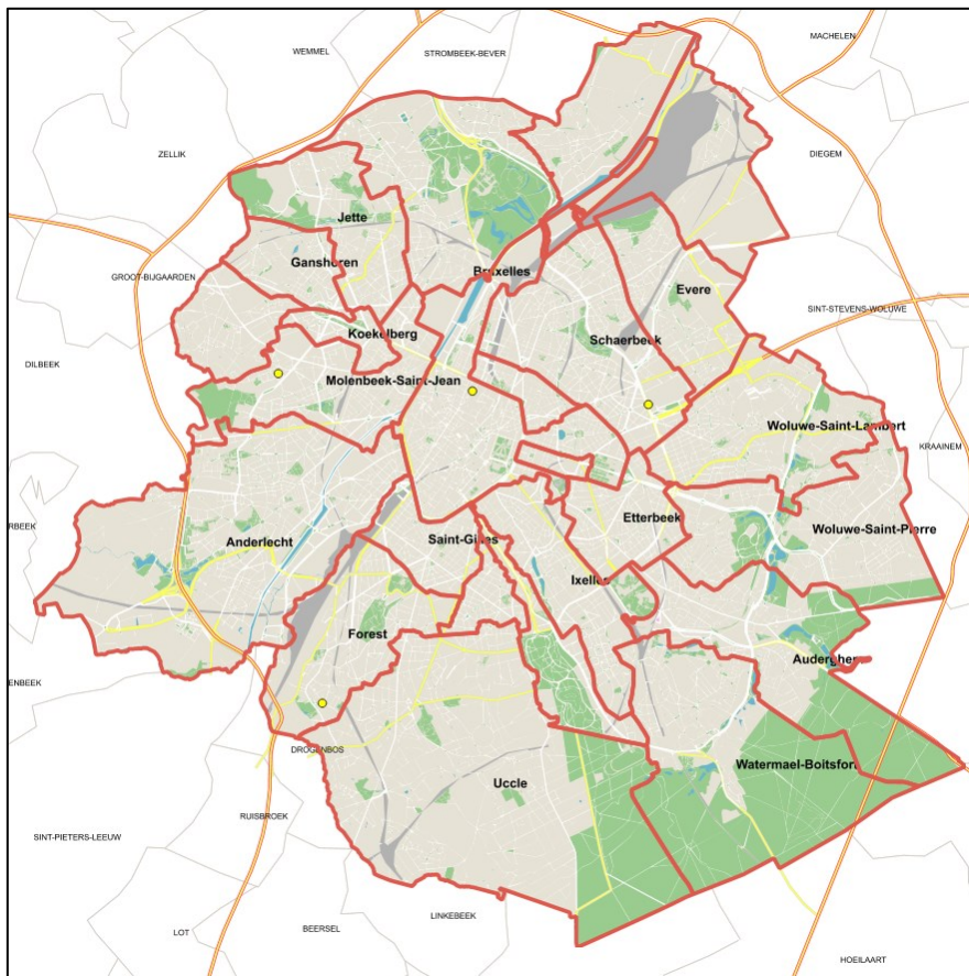
Afbeelding 2 - Overstromingen 08-09/08/2020