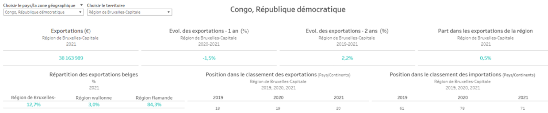
Exportations, importations et balance commerciale (€)

L'ensemble des données peut se retrouver en français, néerlandais et anglais sur https://analytics.brussels/ , dans la section « Bruxelles et le monde : zoom sur l'export bruxellois »