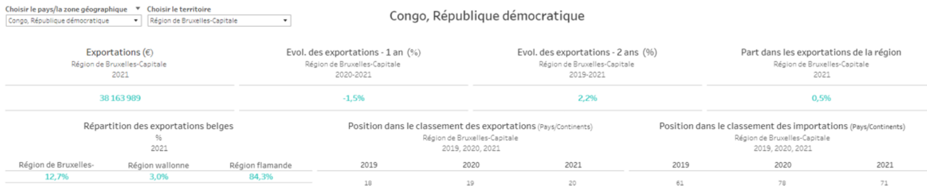
Exportations, importations et balance commerciale (€)

Alle gegevens zijn in het Frans, Nederlands en Engels te vinden op https://analytics.brussels/ , in de rubriek "Brussels & de wereld : focus op Brusselse export".